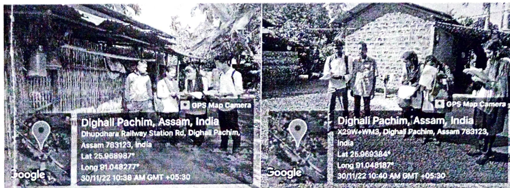
Students with the residents of Adarshapara Village