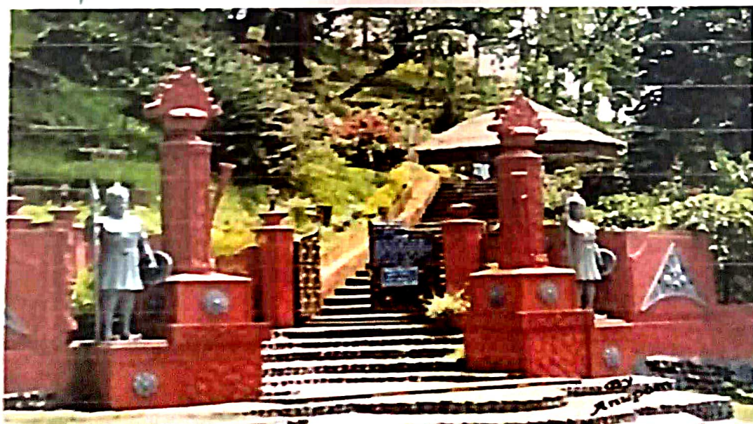
অনিৰুদ্ধৰ স্মৃতি প্ৰবেশ দ্বাৰ

উষা - অনিৰুদ্ধৰ প্ৰেম কাহিনী উল্লেখ আছে। ভাগবত পুৰাণ, ইবিব। ১০ স, - বিষ্ণুপুৰাণ ব্ৰহ্ম - বৈবৰ্তপুৰাণ, কালিকাপুৰাণ, আদিত। শোণিতপুৰত উষা - অনিৰুদ্ধৰ প্ৰেম, পক্ষৰ প্ৰমাণে তেওঁলোকৰ বিবাহ আৰু পৰিণতি ইবি - হৰষ সুদ্ধ - এই সন্মত হাটোৰ জুলী ভাহানিৰ শোণিতপুৰ এতিয়াৰ তেজপুৰ হয় নে নহয় এইটো এটা বিতৰ্কৰ বিষয়। অৱশ্যে কালিকাপুৰাণৰ ৩৯ অধ্যায়ত এই বুলি উল্লেখ আছে যে যি সন্মত, প্ৰাপ্ত্যাতি- পুৰত নৰকাসুৰ বধৰ বাৰত্ৰ কৰিছিল। সেই সন্মত নৰকাসুৰ বন্ধু বাণসুৰ দ্বাৰাৰ শ্বশুৱোগত শোণিতপুৰত বাৰত্ৰ কৰিছিল।