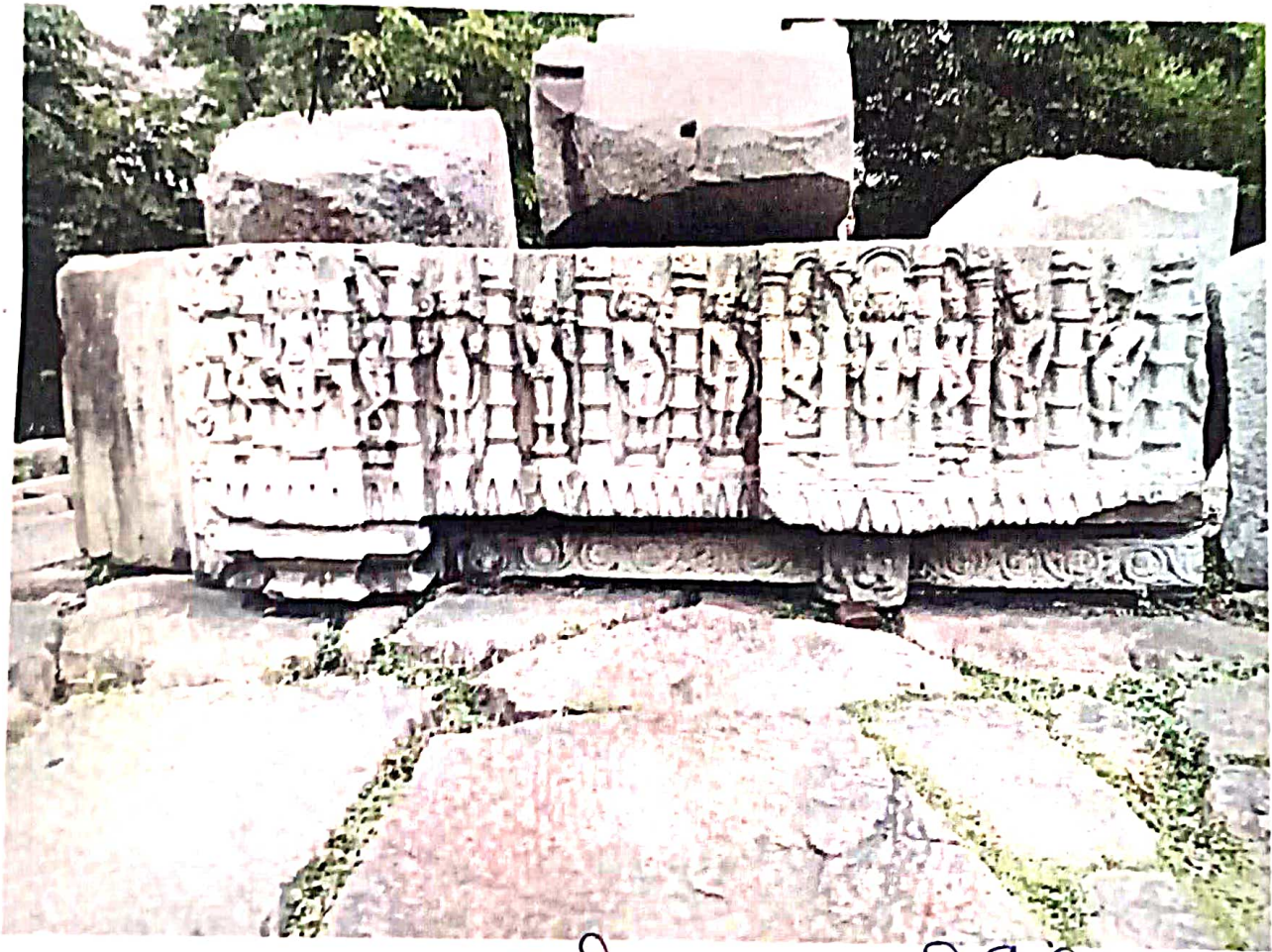
বামুণী পাহাৰৰ কীৰ্তি চিহ্ন

অন্তরাল স্থানস্থ আছিল। অন্তরালসমূহ উপবৃত্তাকার আকৃতির আছিল আৰু সন্দিৰ্ভাঙ বিমূৰ্তক আৰাধনা কৰা হৈছিল। এই সন্দিৰ্ভাঙৰ দুৱাৰসমূহও আশ্চ লিলামণ্ডত বিমূৰ্তক কেইটামান অৱতাৰৰ মূৰ্তি মোদিত আছিল।