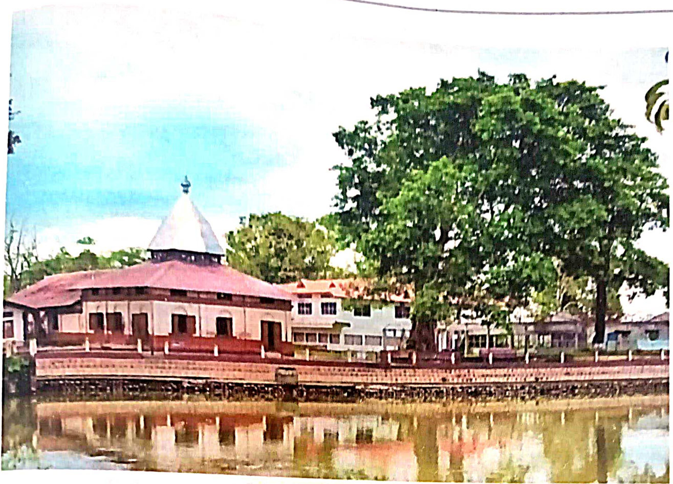
ৰাজ - ৰাজেশ্বৰ মন্দিৰ