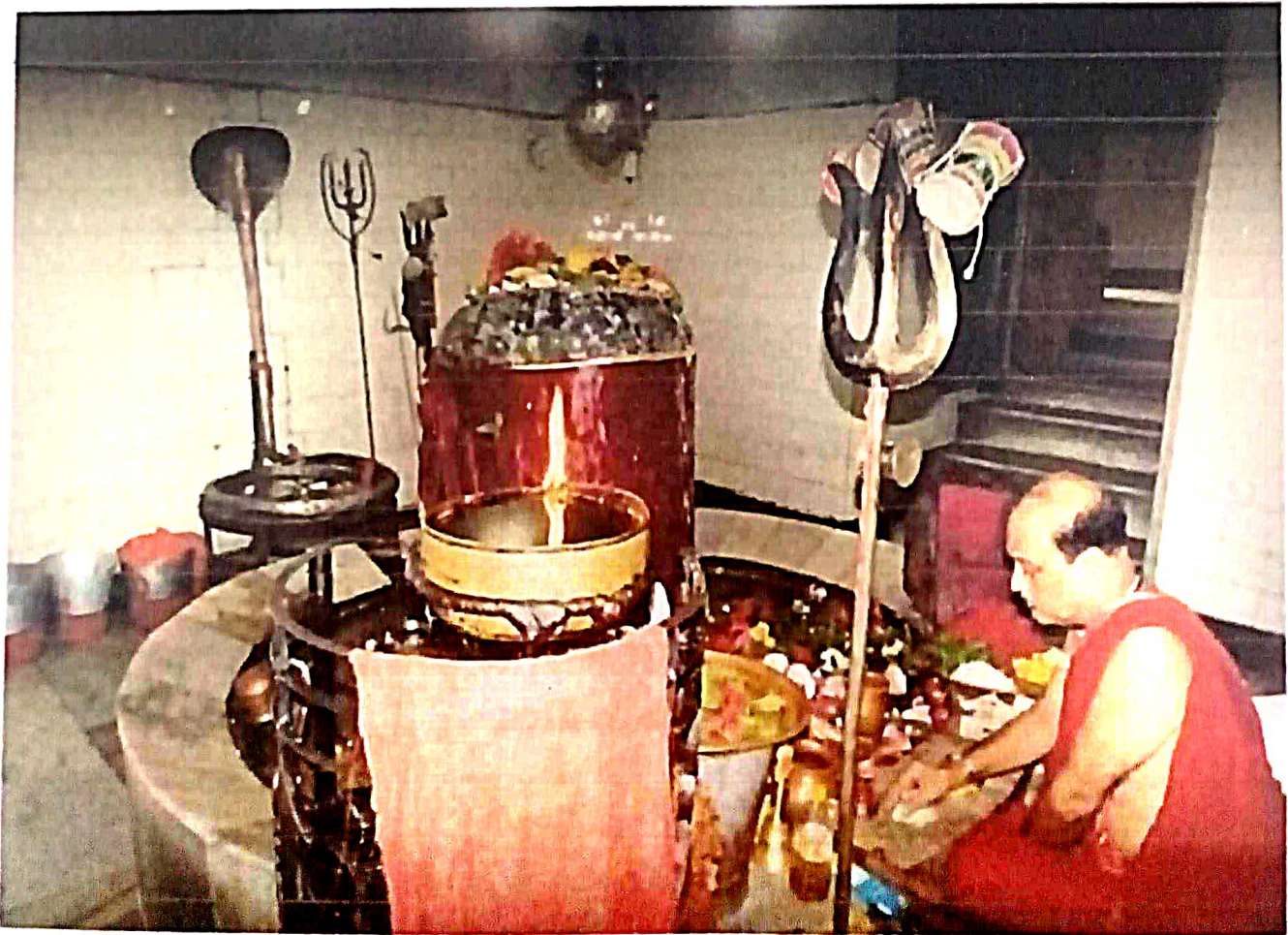
ସନ୍ଦିଗ୍ଧତା ସନ୍ଦିଗ୍ଧତା ଶିବଲିଖନ

ଏହି ସନ୍ଦିଗ୍ଧତା ହିନ୍ଦୁ ଶକଳର ଆବାହ୍ୟ ଦେବତା ଶିବଙ୍କ ନିର୍ଦ୍ଧାରିତ ପୂଜା-ଅର୍ଚ୍ଚନା କରା হয় । ସନ୍ଦିଗ୍ଧତା ହିନ୍ଦୁ ଧାର୍ମିକ ଏକ ୧୫୯୯ କୋଟି ୩ ଲକ୍ଷ । ଏହି ସନ୍ଦିଗ୍ଧତା ବାଣସ୍ତର ନାମର ଏକ ବଜାରି ନିର୍ମାଣ କରିଥିଲ । ବାଣସଜାର ଦୀୟତା ଓୟାହି ଏହି ସନ୍ଦିଗ୍ଧତା ପୂଜା-ଅର୍ଚ୍ଚନା କରିଥିଲ । ସ୍ତୁଳ ସନ୍ଦିଗ୍ଧତା ବିଷୟ ଏକ ବୃକ୍ଷ ଶିବଲିଖନ ଆହୁ । ଏହି ଲିଖନ ଗଠିତ ଏକ ପ୍ରାୟ ୭.୨ ମିଟର ଉଚ୍ଚ ଏକ ୨.୭ ମିଟର । ଏହି ସନ୍ଦିଗ୍ଧତା ଶିବବାସି ଏକ ଶୁଭ-ଧାର୍ମିକ ପାଳନ କରା হয় ।